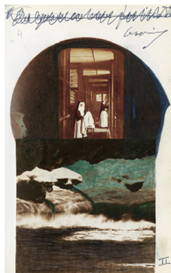
Ilustração ou não?

CENTRO INTERNACIONAL DAS ARTES JOSÉ DE GUIMARÃES